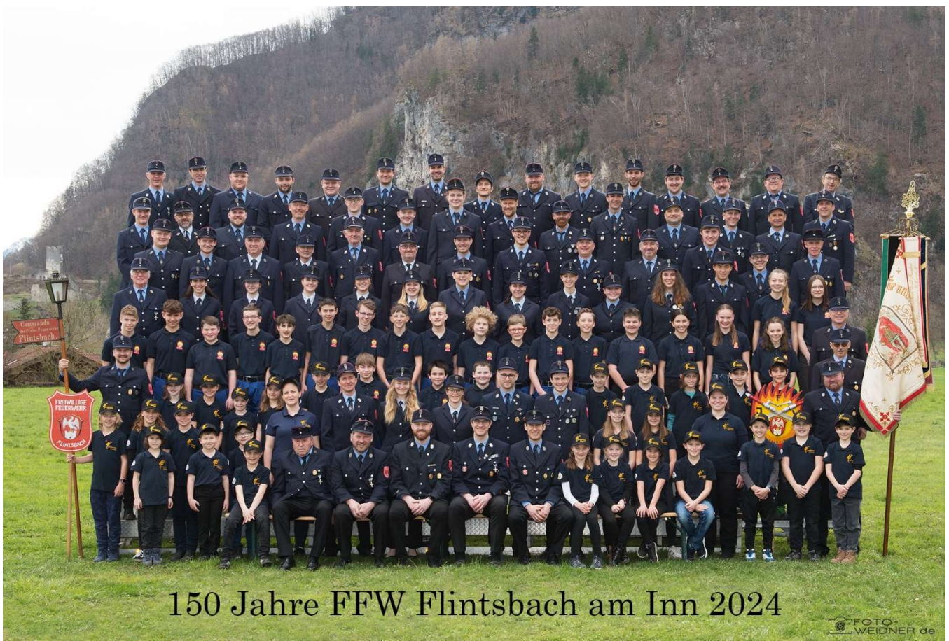
150 Jahre FFW Flintsbach am Inn 2024